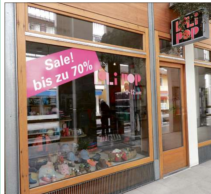
Il Lolipop a Scuol va la fin da quist mais in novs mans.